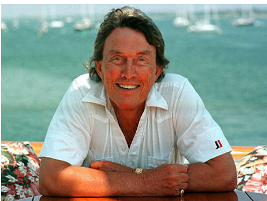
จิมมี่ ดีน (Jimmy R. Dean)

“ในการล่องเรือ ผมไม่สามารถ เปลี่ยนทิศทางของลมได้ แต่ด้วยการ ปรับใบเรือ ผมไปถึงเป้าหมายที่ ต้องการได้เสมอ ”